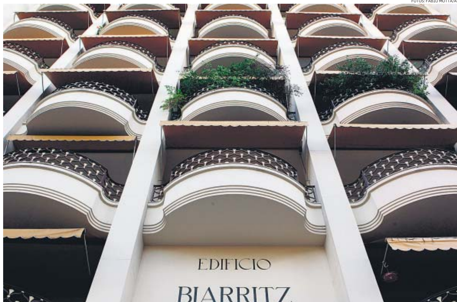
Edifício Biarritz. Na Praia do Flamengo, foi projetado em 1940 por Henri Sajous e faz parte do roteiro de visitas do congresso